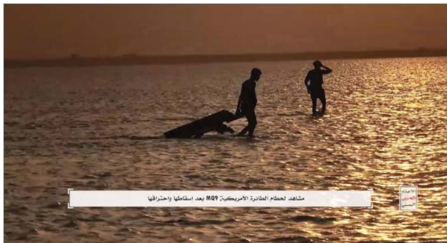
مشاهد لحطام الطائرة الأمريكية MQ9 بعد استهدافها واختراقها

وفي السياق ذاته، نسلط الضوء على آخر ثلاث عمليات للقوات المسلحة اليمنية التي