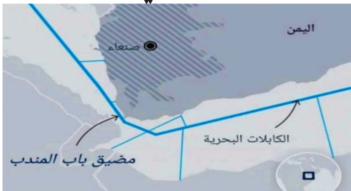
الكابلات البحرية... وأشَارَ البيان إلى ما أكدته شركة الاتصالات بصنعاء «بأن صنعاء ليست لها علاقة بتلف الكابلات الدولية المزودة لخدمات الإنترنت في وقت سابق،

واعترفت وزارة النقل، وهيئة الشؤون البحرية، «بقطع الكابلات البحرية تصرفاً غير مقبول ومدان من اليمن وكل دول العالم؛ كونه عملاً إجرامياً وغير قانوني»، مؤكّدين أن «العدو الإسرائيلي وأمريكا وبريطانيا يسعون منذ بداية عملياتهم اللا مشروعة في البحر الأحمر إلى إثارة الوضع بأدعائهم الكاذبة فيما يخص