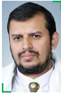
السيد/ عبد الملك بدر الدين الحوثي

نقول للدول الأوروبية: سفنكم يمكنها العبور بكل أمان لكن عندما تورطون أنفسكم مع الأمريكي خدمة للإسرائيلي، فأنتم تخاطرون بمصالحكم ومصالح شعوبكم بكل ما تعنيه الكلمة.