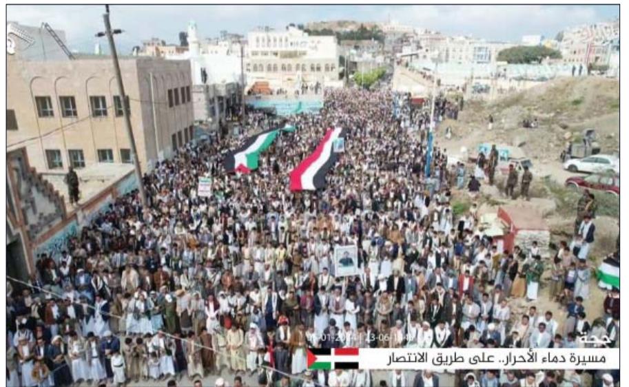
مسيرة دماء الأحرار.. على طريق الانتصار