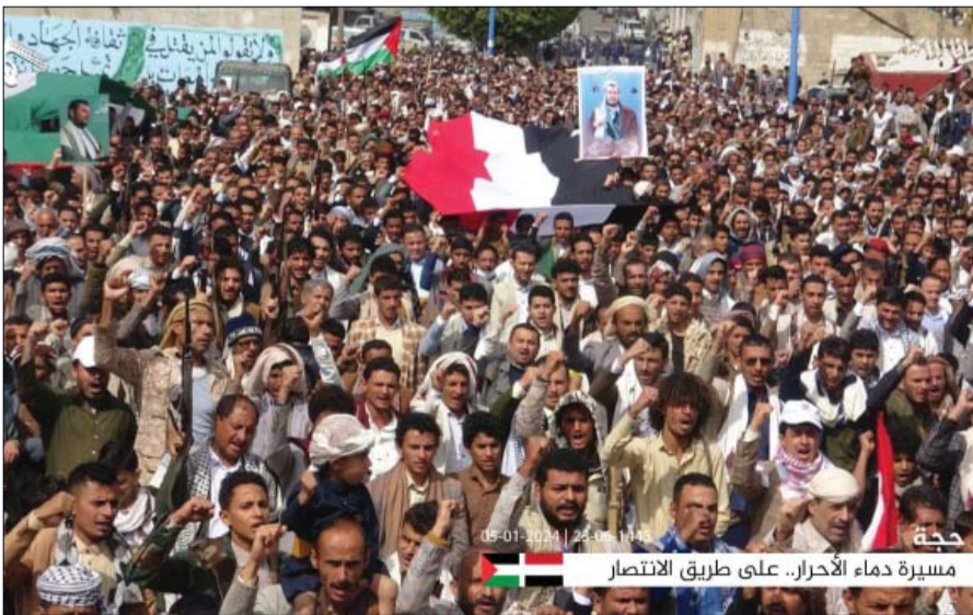
مسيرة دماء الأحرار.. على طريق الانتصار