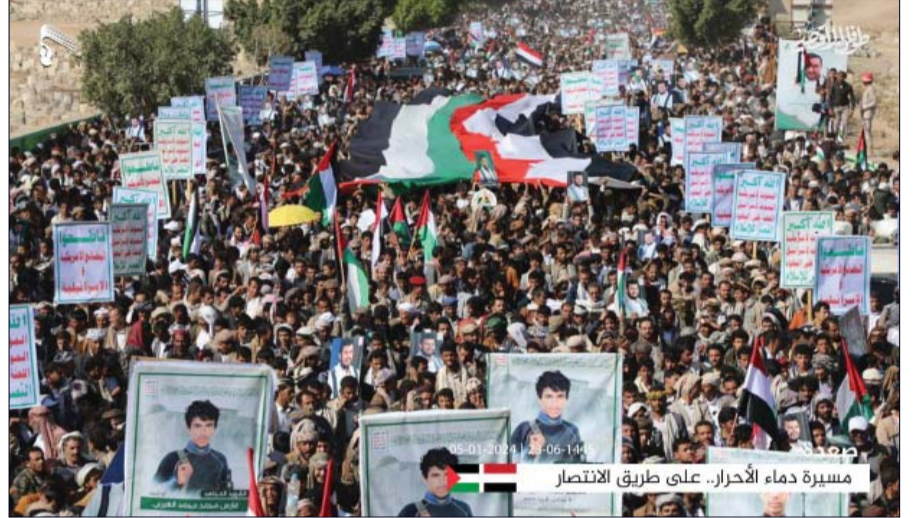
مسيرة دماء الأحرار.. على طريق الانتصار