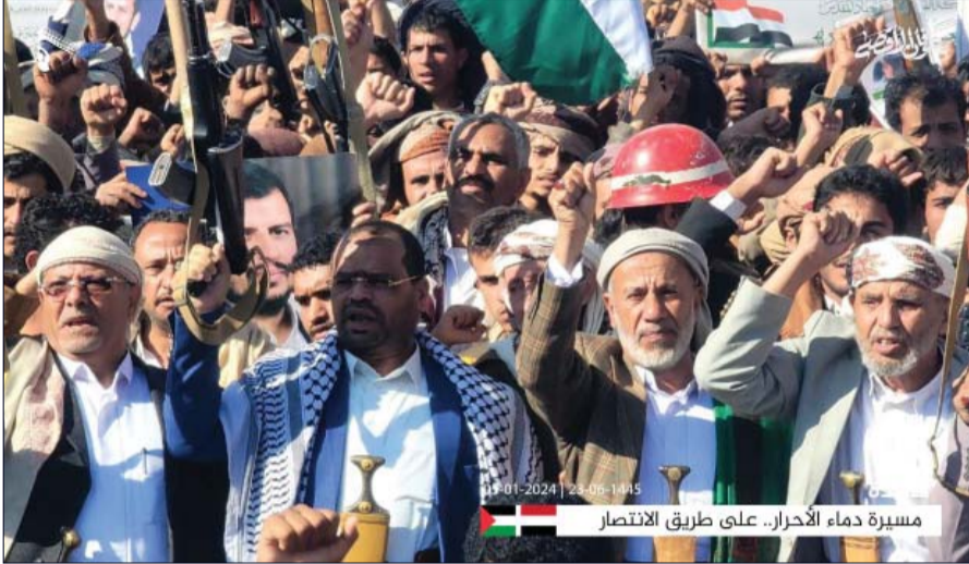
مسيرة دماء الأحرار.. على طريق الانتصار