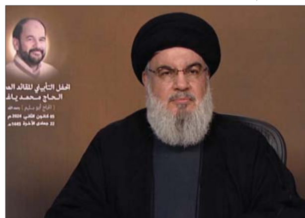
الخطب الثوري للقائد العام الحاج محمد باقر الروح أبو سليم | صنعاء 05 تشرين الثاني 2023 م 22 محرم الآخر 1445 هـ

العالم العربي، وأنصار الله والسيد عبد الملك الحوثي والحكومة في صنعاء منذ اليوم الأول كانوا يسألون عن صورتهم ومكانتهم عند الله سبحانه وتعالى فقط، واليوم عندما ذهب اليمن إلى خطوة متقدّمة في البحر الأحمر سكت الخانعون بل يهتوا». وأشار إلى أن «الموقف اليمني جعل الكثير من الشرائح تعيّد النظر في موقفها الداخلي في موقفها من أنصار الله، وسقطت الأقنعة في حرب السنوات التي فرضت على اليمنيين وكانت حرباً أمريكية تنفّذها أنظمة عربية». وقال: «اليوم ثبتت اليمن في المعادلات الإقليمية والدولية التي يقف أمامها العالم على رجل ونصف، وفضحت الإسرائيلي والأمريكي، متسائلاً: «أين هو سلاح الجو الإسرائيلي من اليمن اليوم؟ هذا هو الردع اليمني».