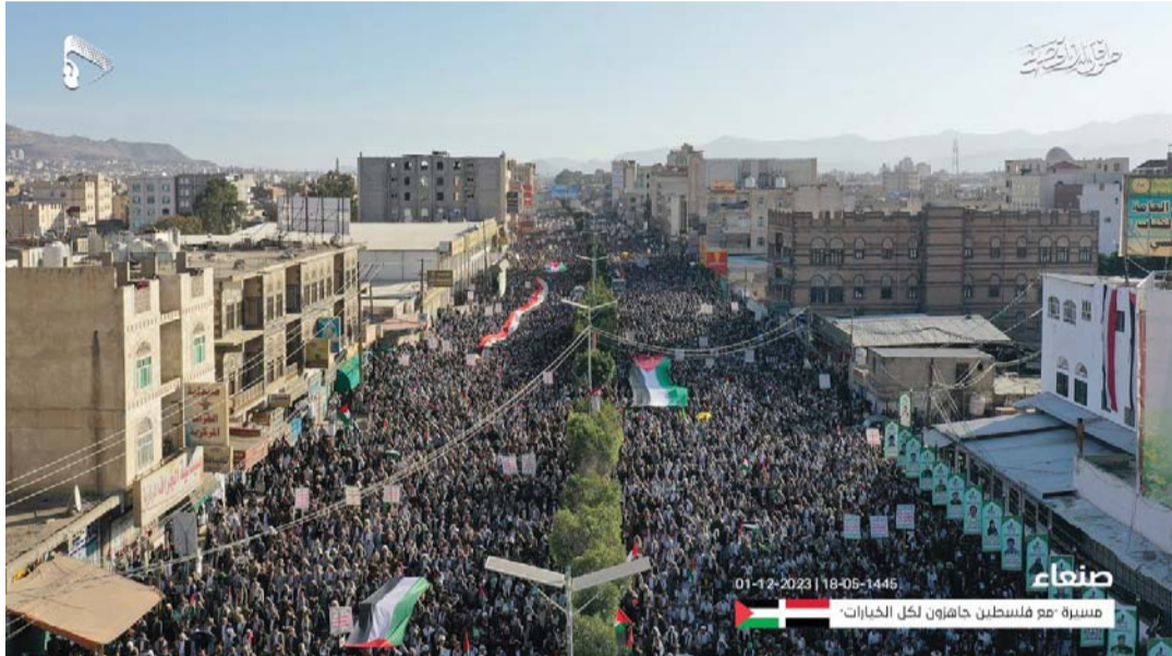
صنعاء مسيرة «مع فلسطين جاهزون لكل الخيارات» 01-12-2023 | 18-05-1445

ووسط ارتفاع أصوات الكرامة والحرية، رفع المشاركون الأعلام الفلسطينية واليمنية