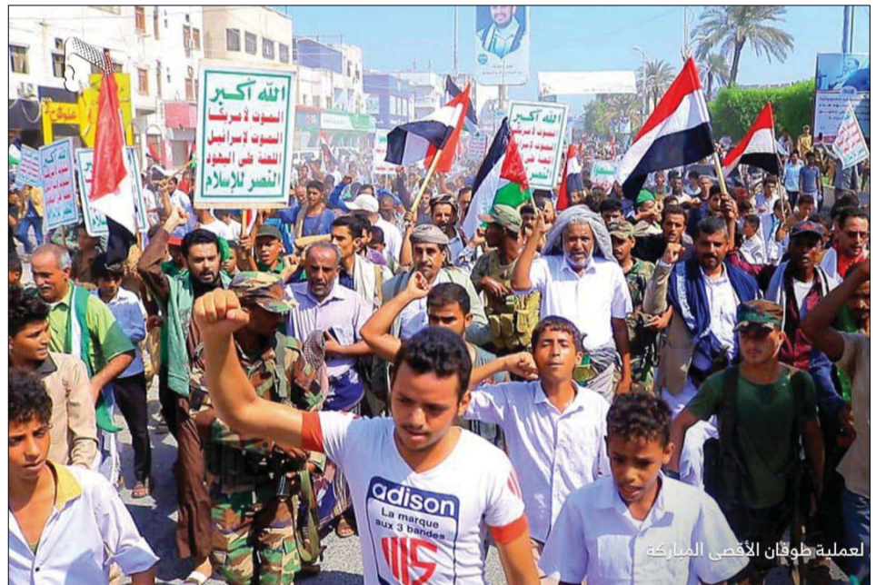
العملية طوفان الأقصى المباركة

و دعمه و مساندة لاستعادة حقوقه المشروعة و أراضيه المحتلة.