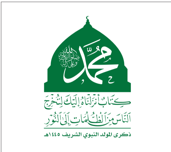
ذكرى المولد النبوي الشريف ١٤٤٥ هـ

ففي إقامة ذكرى مولد النبي صلى الله عليه وسلم وما يحدث على الثناء والصلاة عليه، وهو واجب أمرنا الله تعالى به، قال تعالى: «إِنَّ اللَّهَ وَمَلَائِكَتَهُ يُصَلُّونَ عَلَى النَّبِيِّ، يَا أَيُّهَا