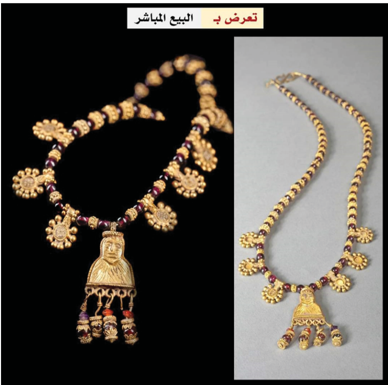
تعرض ب البيوع المباشر

هذه المجموعة مقابل قاعدة بيانات الإنترنت للأعمال الفنية المسروقة. ويبيّن الخبير في الآثار اليمنية، أن عقداً (قلادة) كبيراً مرصعاً مكوّنًا من خرز عقيق كروي تتخللها حبات من الذهب المحبب، ست دلايات ذهبية ثنائية الوجه تحيط بالقلادة المركزية، كل منها عبارة عن قرص به مركز شكل متقاطع مصوغة بطريقة متقاطعة، بعضها غائب، مُشع إلى الحافة، حلقة تعليق أنبوبية مع شارات محببة، تشكلت القلادة المركزية الكبيرة على شكل تمثال نصفي ذي وجهين مع ملامح منمنمة، وأربع حلقات من الأسفل مع العقيق، والجمشت، والعقيق الأحمر، والخرز الذهبي، أما القفل حديث.