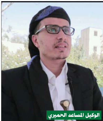
الوكيل المساعد الحميري

ويضيف في حديثه لصحيفة «المسيرة» أن الشعب اليمني هو أحد الشعوب التي تعطي هذه المناسبة المكانة الكبيرة، على غيره من الشعوب، وقد تعود الشعب اليمني أن يجعل من هذه المناسبة محطة إيمانية وتربوية يستفاد منها الاستفادة العملية التي تجعل من الأمة أمة قوية وعزيزة ومستقلة، ولا غرابة فالإيمان يمان والحكمة يمانية، كما يقول رسول الله صلى الله عليه وآله وصحبه وسلم، لافتاً إلى أن اليمنيين يتمسكون بمواقف أجدادهم الأتباع، والذين استجابوا لرسول الله وأولوه الاهتمام الكبير، فاليمينيون اليوم يؤكّدون أنهم الأحقّ برسول الله، وأنهم سيظلون على العهد محبة واقتداء وتولياً لرسول الله، وفي الوقت الذي يشرق فيه الكثير ويغربون، يذهب اليمنيون إلى التمسك برسول الله كخير قائد وقُدوة،