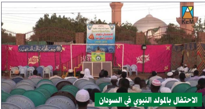
الاحتفال بالمولد النبوي في السودان

وما إن يطل شهر ربيع الأول إلا وتجذ غالبية دول العالم الإسلامي تكتسي