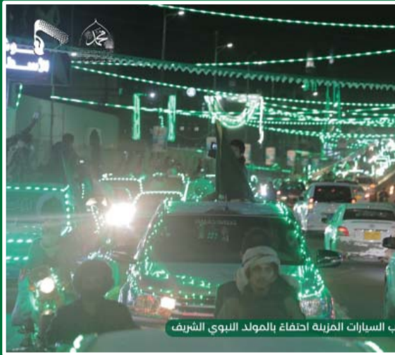
صنعاء: موكب السيارات المزينة احتفاءً بالمولد النبوي الشريف