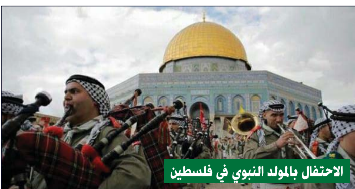
الاحتفال بالمولد النبوي في فلسطين