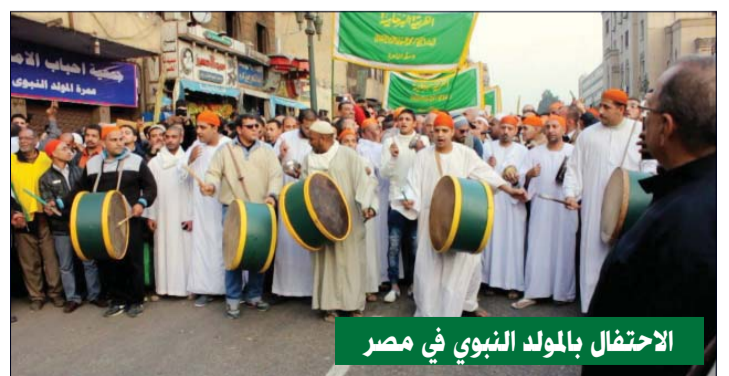
الاحتفال بالمولد النبوي في مصر