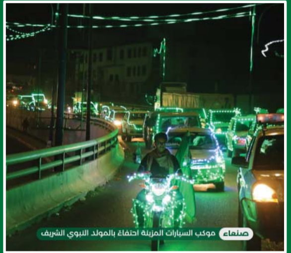
صنعاء: موكب السيارات المزينة احتفاءً بالمولد النبوي الشريف

مؤرخي الإسلام قولهم بأن الملك المظفر أبو سعيد كوكبري ملك إربل الذي توفي سنة ٦٢٠ هجرياً أول من احتفل بالمولد، وقد أثنى عليه العلماء ثناءً عاطفياً بسبب ما أبدى من اهتمام بالغ بهذا الاحتفال وما أنفق فيه من أموال طائلة وما بذل فيه من أوجه السر والصدقات وإطعام الطعام وغير ذلك مما أطنب المؤرخون في وصفه.