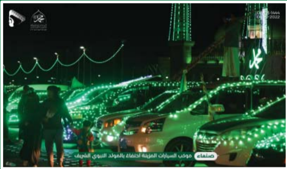
صنعاء: موكب السيارات المزينة احتفاءً بالمولد النبوي الشريف