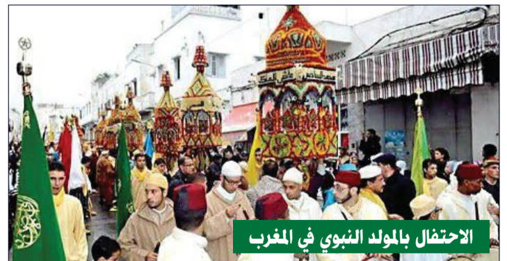
الاحتفال بالمولد النبوي في المغرب