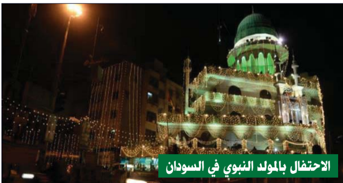
الاحتفال بالمولد النبوي في السودان