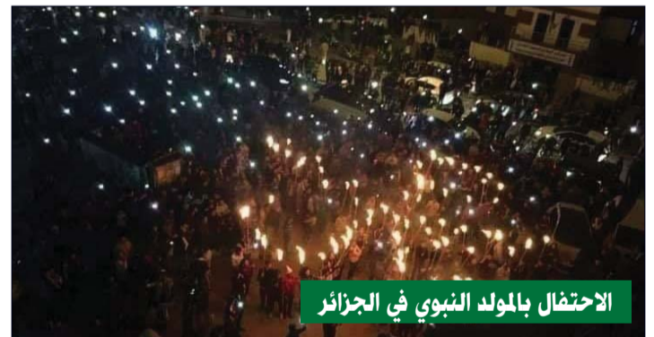
الاحتفال بالمولد النبوي في الجزائر