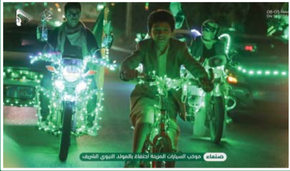
صنعاء: موكب السيارات المزينة احتفاءً بالمولد النبوي الشريف