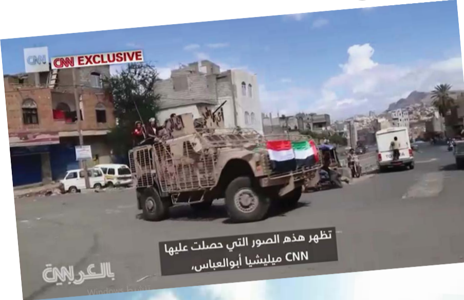
تظهر هذه الصور التي حصلت عليها CNN ميليشيا أبو العباس،

كما رصدت المصادر والمعلومات عزم التكفيريين على عملية انتحارية كان مخططاً لها أن تستهدف بدراجة نارية مفخخة نقطة حرية في مديرية الشعر بمحافظة إب بتاريخ ٢٠١٨/٤/١٣ م، حيث تم التنسيق لتنفيذ العملية بين عناصر تنظيم داعش وعناصر وقيادات من ما يسمى اللواء (٢٠)