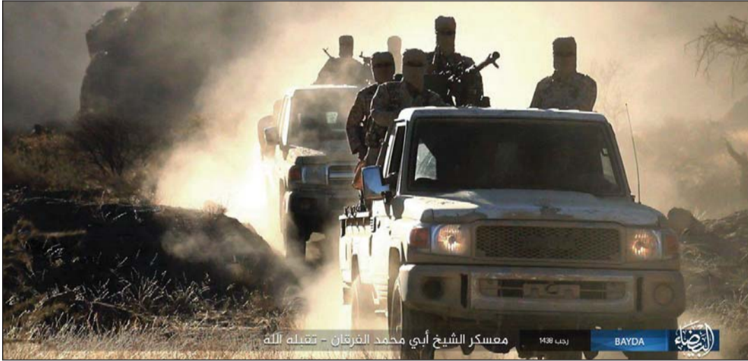
معسكر الشيخ أبي محمد القرقران - تسببه الله

ويضيف الشامي أن العملية تكشف تبني تحالف العدوان مجمل العمليات الإجرامية التي تمارسها القاعدة و«داعش» في مختلف المحافظات بشكل عام وفي محافظة البيضاء على وجه