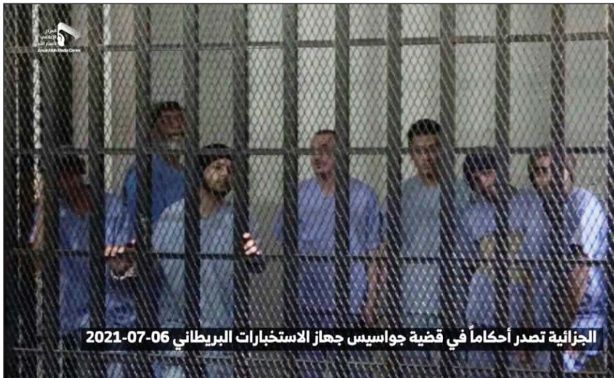
الجزائية تصدر أحكاماً في قضية جواسيس جهاز الاستخبارات البريطاني 2021-07-06