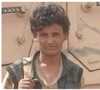
مباركاً الانتصارات التي حققها ويحققها أبطال الجيش والأمن واللجان الشعبية

وأهاب المجلس، بالجميع التكاتف لإسقاط رهانات العدوان الرامية إلى تقسيم وتمزيق اليمن، حاثاً على مواصلة اليقظة في مواجهة العدوان وأدواته وتحقيق المزيد من الانتصارات.