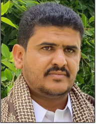
من قصيدة (لله عاقبة الأمور) للشاعر ضيف الله سلمان