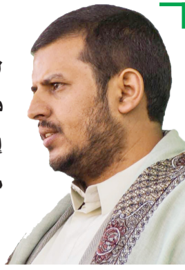
السيد / عبد الملك بدر الدين الحوثي

هناك عمل جارٍ لتطوير منظومات دفاع جوية تتصدى للطائرات الحديثة وللقدرات الأمريكية التي تشتغل فوق سماء بلدنا، وهذا سيعتبر إنجازاً كبيراً جداً، كلما حققنا إمكانيات كلما تمكن بلدنا من بناء إمكانيات وتطوير قدرات في مواجهة التقنية الحديثة الأمريكية.