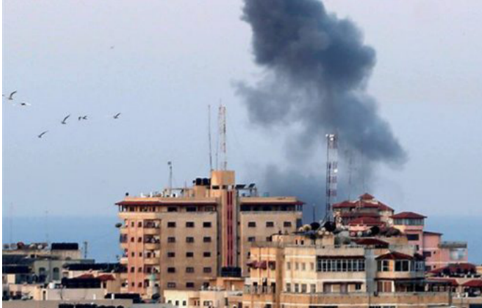
الصهيوني، أمس الأول، ثلاثة فلسطينيين بينهم طفلان شقيقان في بلدة سلوان جنوب المسجد الأقصى المبارك بالقدس المحتلة.

وينفذ المستوطنون الصهاينة يومياً اقتحامات استفزازية للمسجد الأقصى بحماية قوات الاحتلال في محاولة لفرص أمر واقع بخصوص تهويد الحرم القدسي والسيطرة عليه.