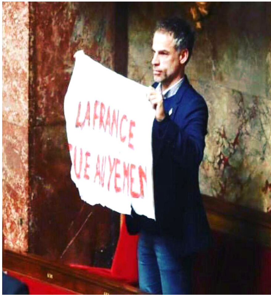
عضو البرلمان الفرنسي سبستيان نادوت ينشر لافتة في الجمعية الوطنية الفرنسية «فرنسا تقتل اليمن»

أيضا اتجهت ستجد أن شعوب المنطقة متفقون على شيء واحد وهو غياب القادة، ومتفقون على أن هزيمة الأمة جاءت من هذا الباب، هؤلاء يختلفون في كل شيء، لكنهم لا يختلفون على هذه الحقيقة، لو سألت أحدهم كيف تريد أن يكون القائد؟ ستجدهم يجتمعون على أنه ذلك هو الذي بمقدوره أن يواجه الهجمة الشرسة علينا نحن في الوطن العربي، ويخلصنا من دائرة الخوف من الدخول إلى المعركة الضرورية لبقائنا على قيد «الإنسانية»، فضلاً عن الاستقلال والكرامة والحرية. مسألة تحتم وجود قائد، إنّه المخلص بالنسبة لي.