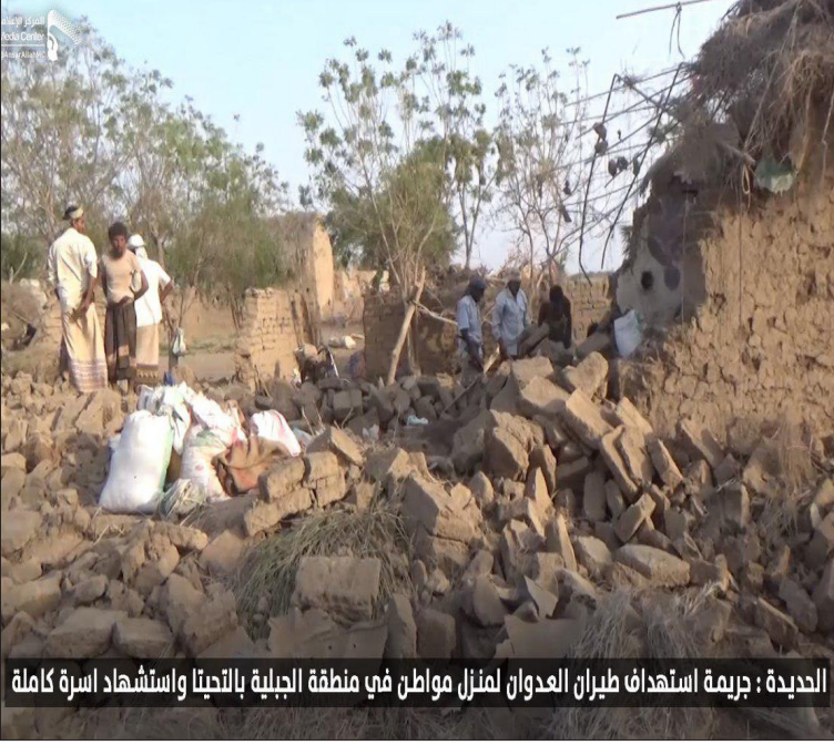
الحديدة: جريمة استهداف طيران العدوان لمنزل مواطن في منطقة الجبلية بالتحيتا واستشهاد أسرة كاملة

وفي محافظة حجة، استشهد 8 مدنيين بينهم أطفال وأصيب اثنان آخران بغارات لطيران العدوان على منطقة المورم بمديرية حرض، بالتزامن مع استشهاد 6 مواطنين وإصابة 3 آخرين إثر استهداف منزلهم بغارتين في منطقة رام بمديرية مستبأ.