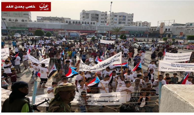
عدن خاص بعدن انفرد

ويتعمد تحالف العدوان وسلطات المرتزقة تجاهل تلك التظاهرات، فيما يزداد نطاقها يوماً بعد يوم؛ بسبب تفاقم المعاناة الإنسانية الناجمة عن انهيار الاقتصاد اليمني الذي أدت إليه سياسات العدوان ومؤامراته.