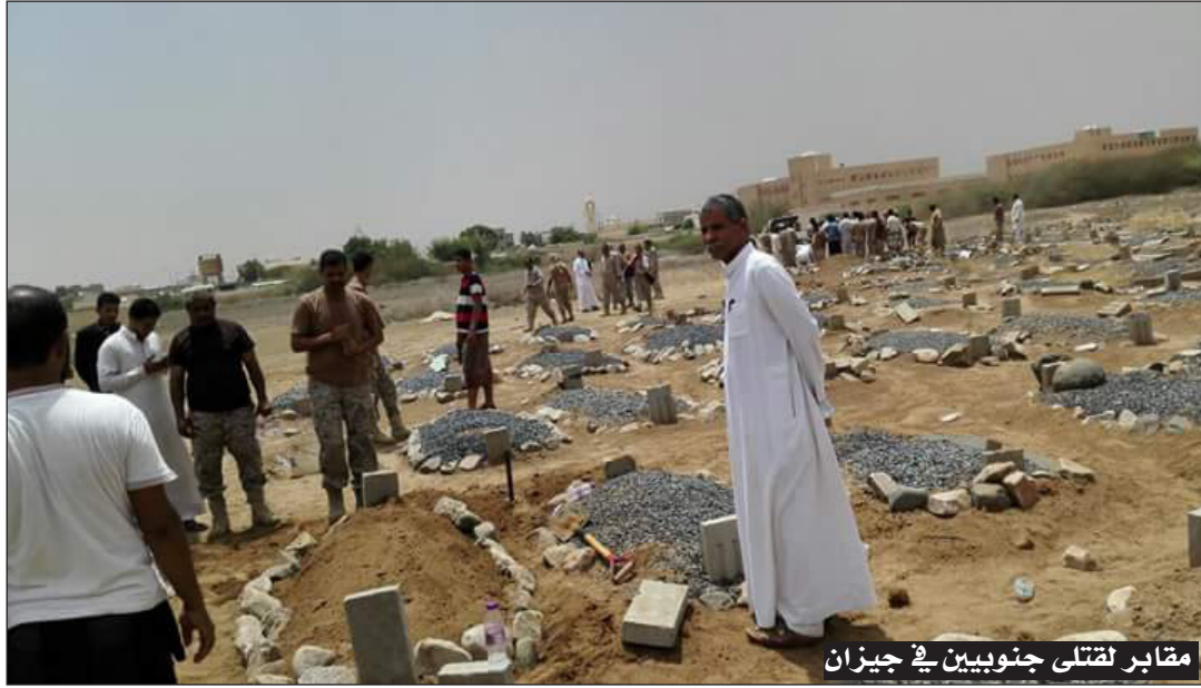
مقابر لقتلى جنوبيين في جيزان

إلى هذا المستوى المنحط مما لا يخطر في بال تجاوز النظام السعودي كُله المعايير الإنسانية والقوانين والأعراف البشرية، وبشكل ربما أنه لم يحدث من قبل، على أن توسع رقعة الحرب وطول أمدها كان كفيل بإخراج بعض هذه الفضائح ونز من الانتهاكات، بينما يبقى مخبوء عن في رسم الأيام القادمة وفي علم ودراية الإدارة الأمريكية وأجهزة استخباراتها.