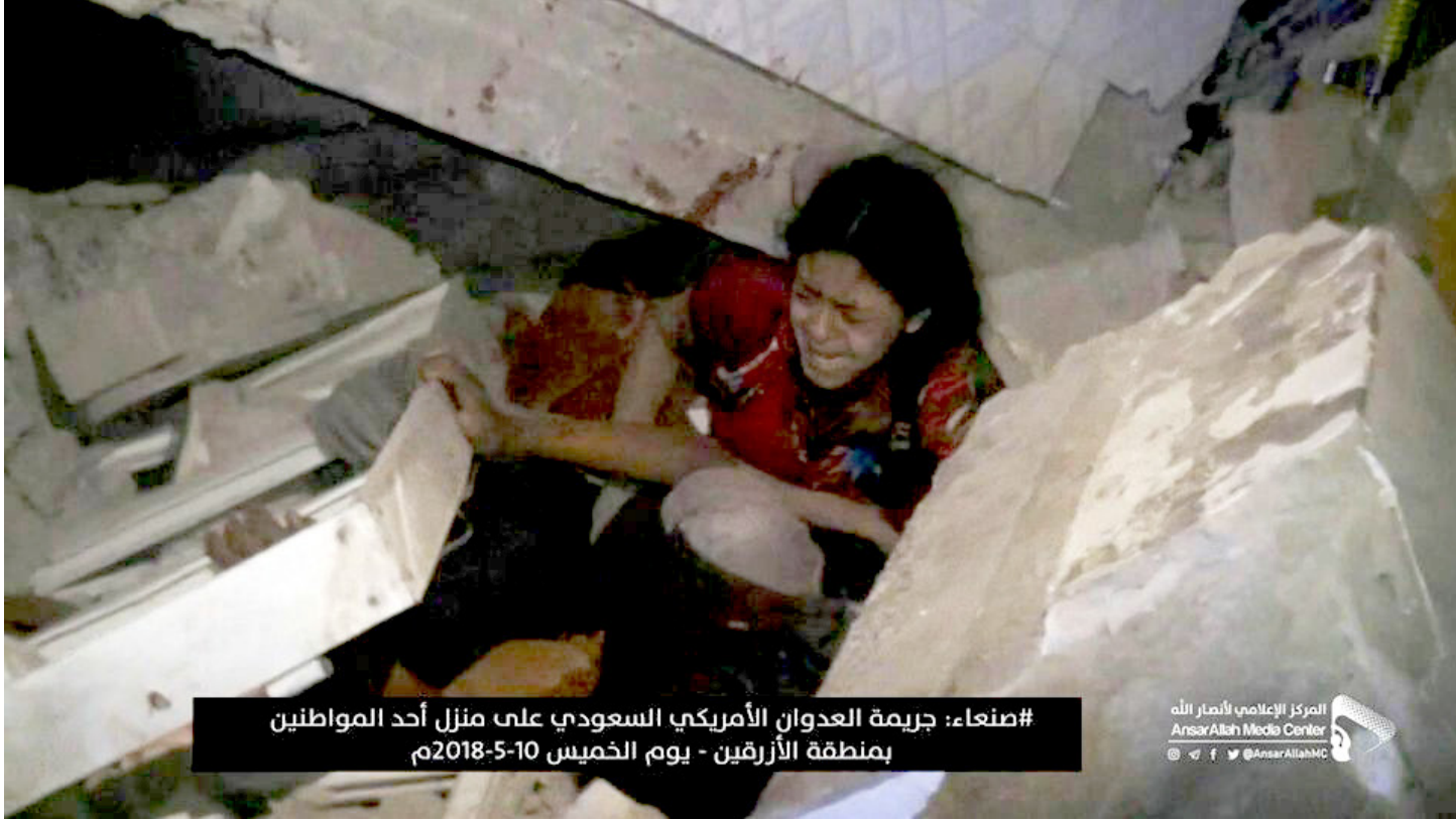
#صنعاء: جريمة العدوان الأمريكي السعودي على منزل أحد المواطنين بمنطقة الأزرقين - يوم الخميس 10-5-2018م

المركز الإعلامي لأنصار الله AnsarAllah Media Center @AnsarAllahMC