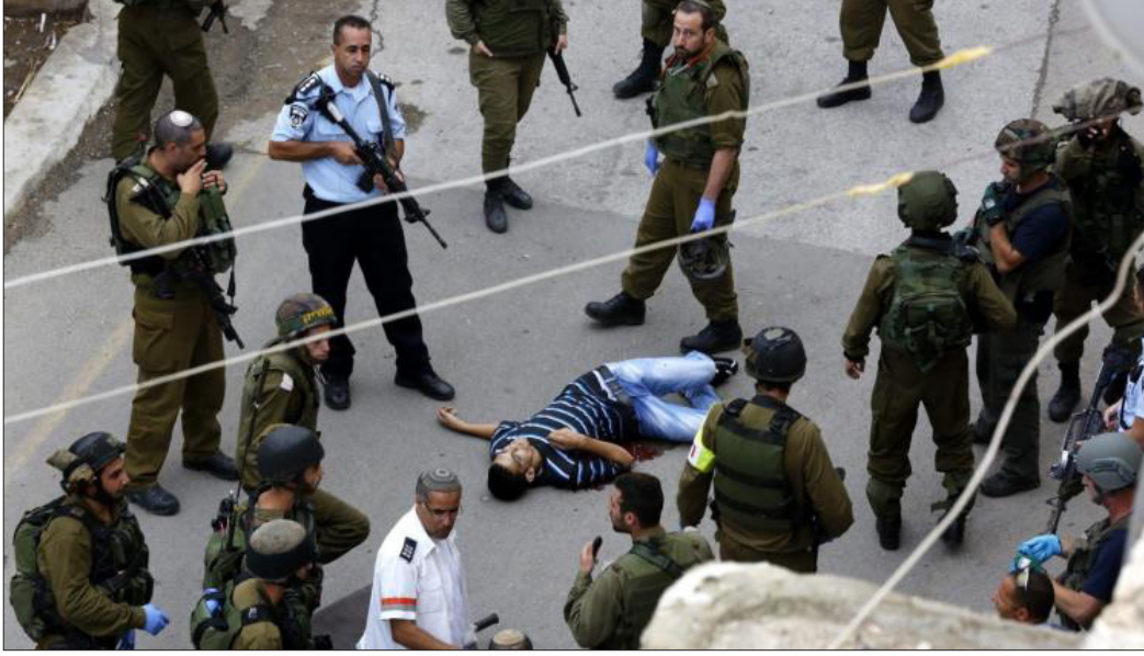
بأن فلسطينياً استشهد، أمس، بنيران جنود العدو الصهيوني خلال تلك المواجهات، فيما أصيب أكثر من 100 آخرين بجروح وبحالات اختناق. وكان قوات العدو الصهيوني قد ارتكبت مجزرة كبيرة بحق المتظاهرين

وفي القدس اعتقل الجنود الصهاينة أربعة شبان فلسطينيين من منازل ذويهم في بلدة صورباهر.