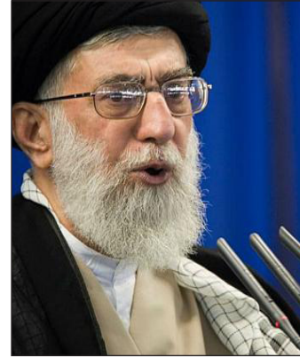
الدعم للمجاهدين الفلسطينيين يعد واجباً دينياً وفريضة إنسانية وهو

قال الإمام علي خامنئي - المرشد الأعلى الإيراني - في رسالة جوابية على حركة حماس أمس الأول ، بأن الطريق الوحيد لنجاة أهل فلسطين المظلومين هو المقاومة والجهاد، وأنه المرهم الوحيد الذي يمكنه شفاء جروح الشعب الفلسطيني الشجاع الأبي ، مؤكداً على أن العودة إلى عزة وكرامة الأمة تتمثل في الصمود امام الاستكبار ومخططاته الخبيثة. وأضاف الإمام الخامنئي: إن تقديم