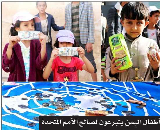
أطفال اليمن يتبرعون لصالح الأمم المتحدة

ومن جانبه أشار مكتب محامي الأطفال في الأمم المتحدة إلى أنه يخشى أن يؤدي هذا التأخير إلى تعرضهم للانتقادات.