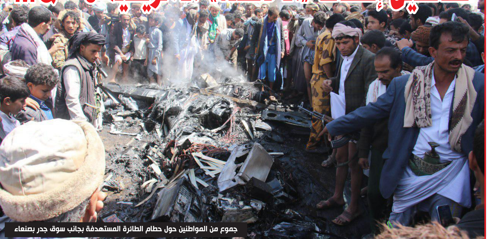
جموع من المواطنين حول حطام الطائرة المستهدفة بجانب سوق جدر بصنعاء