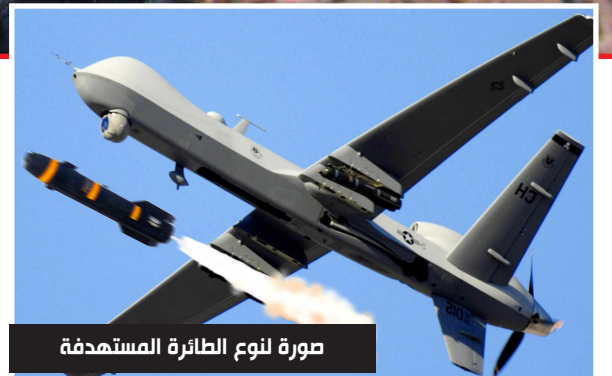
صورة لنوع الطائرة المستهدفة